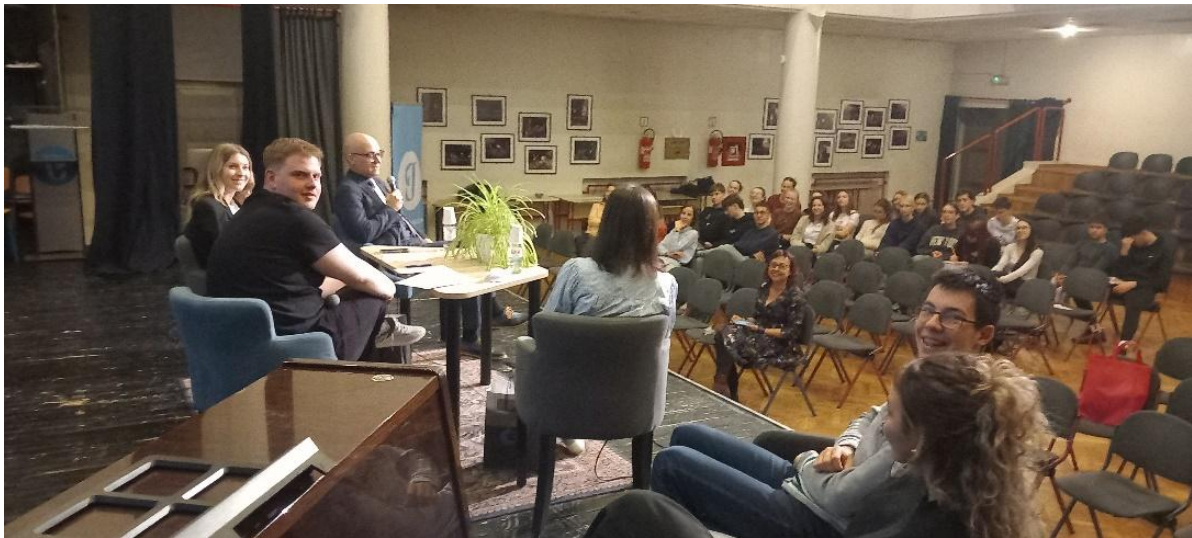
Atmosfera 3bine-pogled s pozornice

Nakon gimnazije upisala je studij kroatistike i sociologije na Filozofskom fakultetu u Zagrebu koji završava 2006. godine. Iste godine upisuje doktorski studij književnosti, kulture, izvedbenih umjetnosti i filma na istome fakultetu. Naglasila je bitan utjecaj i poticaj njezinom znanstvenom radu poznatog hrvatskog književnog znanstvenika i redovitog sveučilišnog profesora Krešimira Nemeca. Od veljače 2008. radi na Katedri za noviju hrvatsku književnost. Doktorirala je 2014. godine, a u zvanju docenta je od 2018. godine.