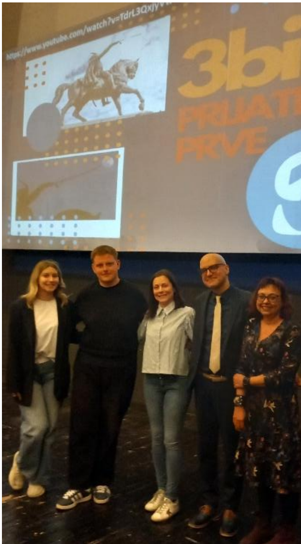
Jedna za sjećanje: Gosti s ravnateljicom i voditeljima 3bine